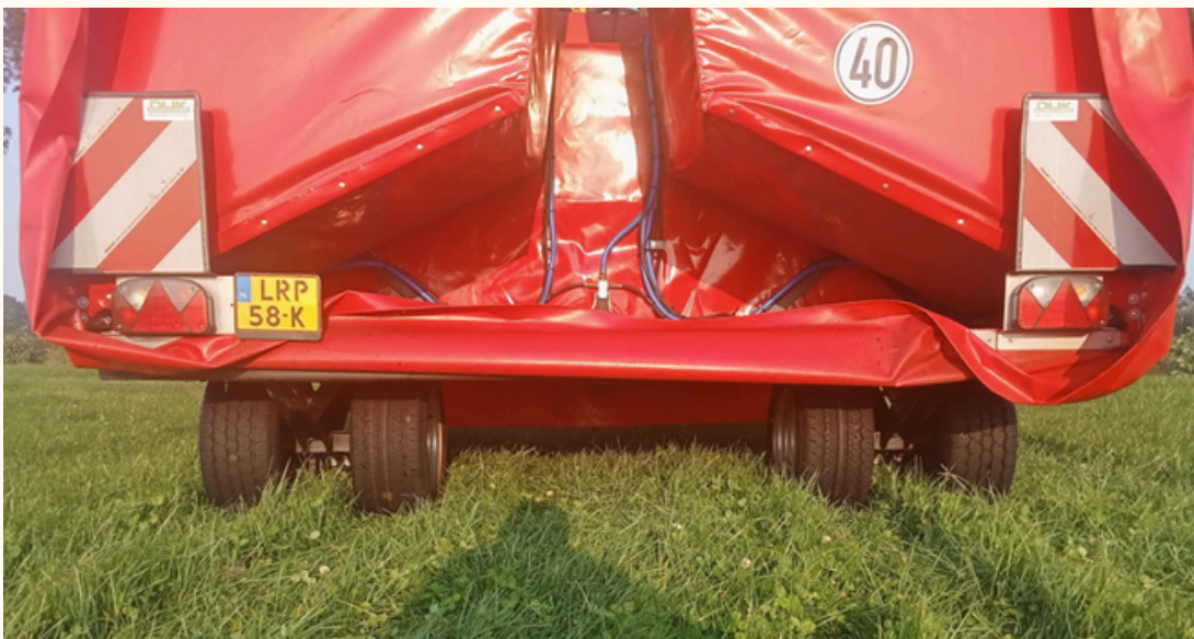
Nieuw is het dubbel wielstel zoals hierboven.