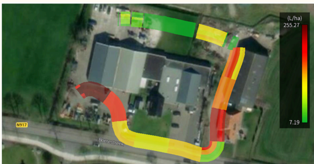
Met de isobus en koppeling met gps hebben we een simulatie gemaakt rondom ons bedrijf hoe deze kaart er ongeveer uit komt te zien.